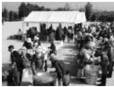
▶防災訓練での「炊き出し訓練」の様子