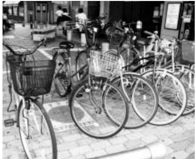
▲自分だけなら大丈夫と思っていませんか 迷惑駐車が事故を招くことも...

放置禁止区域に放置されている自転車は、市が定期的に撤去しています。撤去した自転車は市内2か所の保管場に移し、1か月間保管します。そして、自転車に表示されている住所・氏名や防犯登録番号から所有者に連絡し、速やかに返還できるように努めています。また、盗難車の乗り捨てによる放置も多いことから、自転車に駐輪するときは必ず鍵をかけてください。