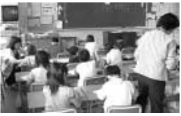
二人の先生による授業

このプランは、子どもたちが、夢と希望をふくらませて学ぶ喜び、生きる喜びを実感できる環境づくりに努めるとともに、学校を夢と希望に満ちた学び舎にすることを目指し、策定しました。 ▲施策の基本的な方向▼ 開かれた学校づくり：施設や教育内容を広く地域社会に開き、学校を地域社会のコミュニケーションセンターとして、家庭・地域社会との連携を一層進めます。 学校情報を地域へ家庭や地域社会と協働した学校づくり 子どもたちに確かな学力を：基礎・基本を確実に身につけ、自ら学び、自ら考え、主体的に判断行動し「生きる力」の育成に努めます。 基礎・基本の徹底と確かな学力の向上 社会の変化に対応できる教育の推進 社会の変化に対応できるシステムの構築 子どもたちに豊かな心を：豊かな人間性を育む、心の教育を推進します。 「心の教育」の推進と人権意識の高揚 社会体験活動やボランティア活動の推進 文化・芸術の振興 新しい教育環境の整備：子どもたちを取り巻く環境が大きく