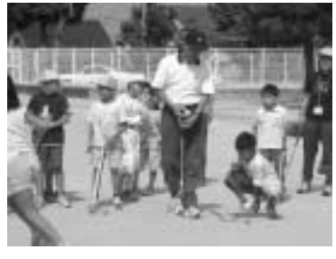
世代を超えた学びあい

このプランは、市民の皆さんが、自ら学習する力を身につけて自分らしく生き、お互いに支えあう生活できるような豊かな地域社会づくりを推進するため、市が取り組むべき施策の目標と方向を示したものです。 市では、これまで平成9年に策定した「宇治市生涯学習基本計画」に基づいて、一人でも多くの市民の皆さんが、さまざま