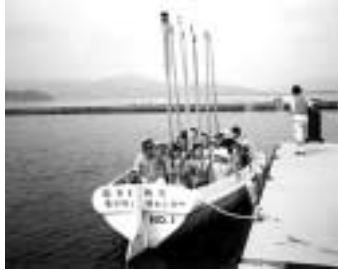
昨年のジュニアリーダー養成学習会(府立青少年海洋センター)

創造性を生かし伸ばすためには、大人一人ひとりが、自らの生き方を個性豊かな創造的なものにして、青少年に対して柔軟な姿勢で接することが大切です。 次代を担う青少年の育成にとって、こうした大人の「意識改革」が重要です。 ▲施策の基本的な方向▼ 青少年が目指す将来像「21世紀を生き抜く心豊かでたくましい青少年」 ●基本目標 ●「青少年が自らの力で成長できる環境づくり」 人と人の交わりを大切に。自然や文化とのふれあいを大切にする。社会とのかかわりを大切にする。自ら考え、行動する力を体得する。