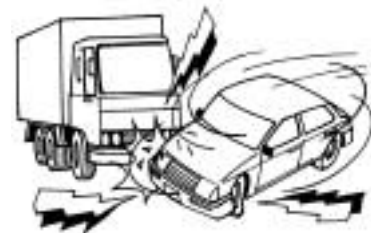
万が一に備えましょう

から治療の日までの期間です。ただし、治療を14日以上中断した場合は、その期間を除きます。