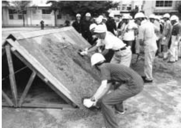
いざというときのために訓練を(昨年の防災訓練の様子)

今回の訓練は、震災発生を想定し、地域で協力して取り組むための初期消火や救出、緊急救命訓練などの具体的な方法について、参加された皆さんに実際に体験してもらいながら、防災意識と災害対応力を高めていただくことを目的としています。なお、榎島中学校グラウンドでは、ヘリコプ