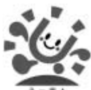
健康づくりシンボルマーク