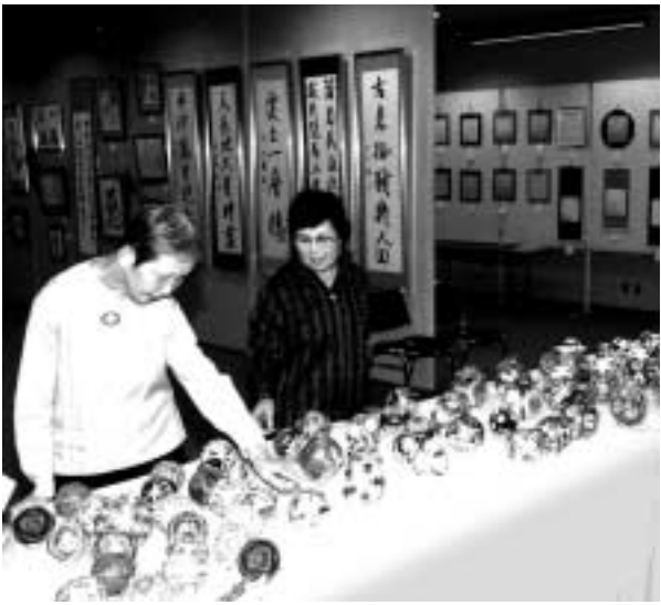
昨年の市民文化芸術祭(展示の部)の様子

市民絵画展実行委員会 とき：11月18日(木)・21日(日)、午前10時～午後5時 ところ：文化センター