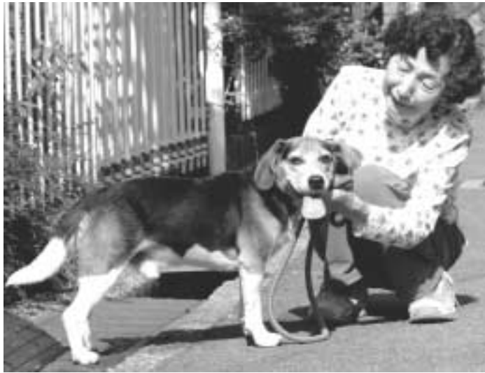
▲愛情と責任を持って飼いましょう

世帯数 73,346世帯 (前月比40世帯増) 人口 191,264人 (前月比25人減) 男 93,581人 女 97,683人