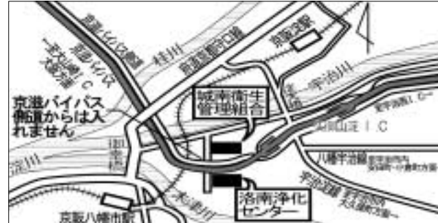
《シャトルバス時刻表》

◆内容：施設の公開、クイズラリー、「エコ・京レンガ」の配布(先着800人)、「フリーマーケット」(環境まつり)とあわせて240店舗程度出店、水処理の模型やパネル、下水道作文コンクール入選作品展示など ◆参加費：無料 問 京都府下水道公社洛南浄化センター