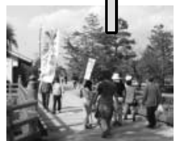
宇治十帖スタンプラリーについての問い合わせ先