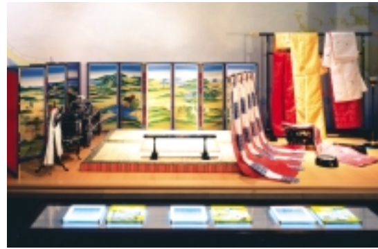
源氏物語ミュージアム 常設展示

市、社会福祉協議会では、このほかにも各種相談事業を行っています。詳しくは16年度版「市民カレンダー」をご覧ください。