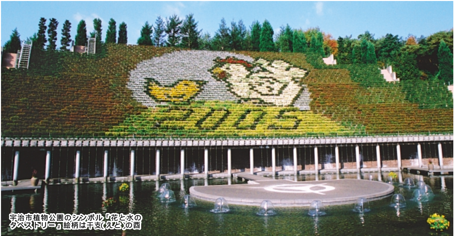
宇治市植物公園のシンボル「花と水の タペストリー」絵柄は千支(えと)の酉

〒611-8501 宇治市宇治琵琶33 ☎ 22-3141 (代表) FAX 20-8779 ホームページ http://www.city.uji.kyoto.jp/