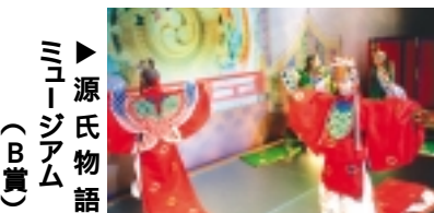
源氏物語ミュージアム (B賞)