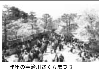
昨年の宇治川さくらまつり