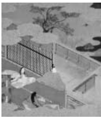
源氏物語ミュージアム所蔵 伝土佐光則筆 源氏絵鑑帖より

桐壺院が亡くなった後、光源氏を嫌う右大臣と弘徽殿太后がしたい放題ふるまっています。なにかと憂うつなことの多い源氏ですが、出家にまでは踏み切れません。 梅雨の合間の晴れた一日、源氏は麗景殿の女御の屋敷を訪れようと外出します。この人は桐壺院の女御だったのです。が、頼りとする人もなく、今は源氏の援助にすがって、妹の花散里とひっそりと暮らしていました。花散里と源氏は、かつてわずかの間ですがかわりを持っていた仲でした。