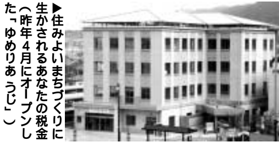
住みよいまちづくりを生かされるあなたの税金(昨年4月にオープンした「ゆめりあうじ」)

確定申告をする義務がない人でも次のような場合は、源泉徴収された所得税が還付されることがあります。ローンなどでマイホームを買ったり増改築をしたりして、住