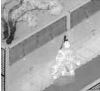
源氏物語ミュージアム所蔵 伝土佐光則筆「源氏絵鑑帖」より

ある弘徽殿女御のちに弘徽殿太后と呼ばれます)とともに政治をとりしきり、光源氏や左大臣家を圧倒します。右大臣にも息子たちがいるのですが、どうやら娘たちのほうが得意なようです。物語では娘たちの活躍のほうが目立ちます。世代としては、右大臣の孫が左大臣の子と世代です。つまり右大臣が左大臣より一世代上になります。若い左大臣が本家の跡取り、年長の右大臣はその叔父といったところです。左大臣、右大臣とも藤原氏です。