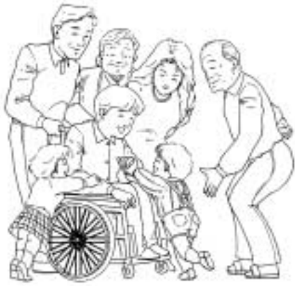
地域で安心して暮らせるように ともに支え合ひましょう

地域福祉計画とは、社会福祉法に基づき、地域福祉の推進に向けて、市民の皆さんの意見を反映させながら、総合的に定める計画です。