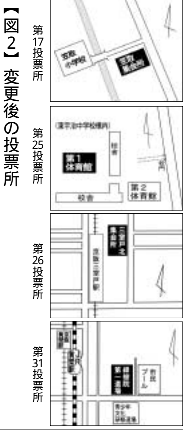
【図2】変更後の投票所

該当地域・投票所について、詳しくは、投票所入場券で確認いただくが、市選挙管理委員会事務局までお問い合わせください。