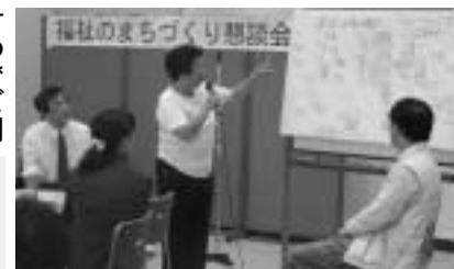
福祉のまちづくり懇談会

〒627-0001 宇治市本町1-1-1 社会福祉協議会 〒627-0001 宇治市本町1-1-1 社会福祉協議会