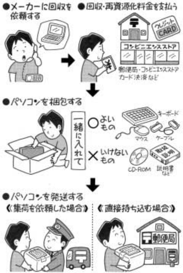
図2 パソコンリサイクルの流れ

メーカーに回収を依頼する なお、ワープロ専用機やプリンター・スキャナーなどの周辺機器は、パソコンリサイクルの対象になりません。従来どおり「もえないごみの日」に収集します(無料)。