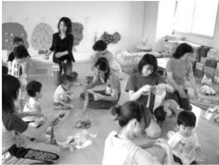
親子のひろば ペットボトルを使ったおもちゃづくり=内容は毎回変わります) R

市では、核家族化・少子化がますます進行する中、育児に對する孤立感や不安感を持つことのないよう、また、地域で子どもを安心して産み育てられる環境をつくるため、地域子育て支援センターを設置しています。子育ての大変さを一人て抱え込まないで、みんなが楽しく子育てができるよう、子育てについて