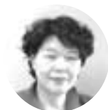
中村地域子育て支援基幹センター長

今年4月、宇治市地域子育て支援基幹センターがオープンしたことに伴い、西部と南部と併せて3か所の地域子育て支援センターとなりました。各センターでは、お母さんたちが子育てを楽しめるように、また、子どもたちが健やかに育つてくれることを願って事業に取り組んでいます。子育てについてのわからないことや悩みなどは相談してできるだけ早く解決することで気持ちも