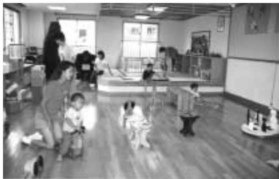
げんきひろば(地域子育て支援基幹センター)

ひろば「ぴよぴよ広場」を開設しています(詳細は下表を参照)。子どもの遊び場や親の交流(しやべり)の場としてご利用ください。さらに、子育て講座や育児講演会も開催しています。