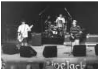
ライブジャック6(昨年)

公募したボランティアの若者が枠にとらわれず創りあげるライブイベント「ライブジャック」。今年も6月と8月の2回開催します。 まずは、ライブジャック7セレクションを6月29日(日)、午後1時から8時まで文化センター小ホールで開催します。このセレクションで実行委員会により選ばれたバンドは、8月3日(日)に行うプレミアムに出場できます。選考には演奏技術などのほか、観客の評価も取り入れます。入場は無料です。