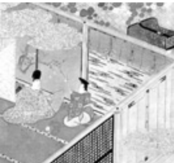
源氏物語ミュージアム所蔵 伝土佐光則筆「源氏絵鑑帖」より

源氏がはっと目を覚ますと、あたりは闇です。護衛を呼び、灯りをつけた時、夕顔はもう意識を失っていました。そしてそのまま、息を吹き返しませんでした。