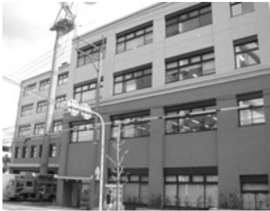
住みよいまちづくりを生かされるあなたの税金 (昨年11月に一部オープンしたうじ安心館)

〒611-8501 宇治市宇治琵琶33 ☎ 22-3141 (代表) FAX 20-8779 ホームページ http://www.city.uji.kyoto.jp/