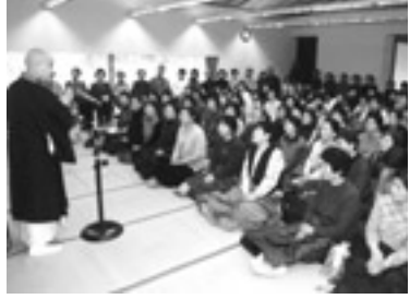
大盛況の昨年の講座

定員：200人(応募多数の場合は抽選) 聴講料：1000円(展示室観覧券付き。当日徴収) 応募方法：往復はがきに住所・氏名・年齢・電話番号を書き、返信用の表にも住所と氏名を書いて、1月18日(土)まで(必着)に源氏物語ミュージアム(〒611-0002 宇治東内45-26、☎39-9300)へ。応募は一人一通に限りです。