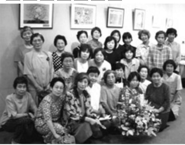
(今年8月31日・9月1日に同サークル開催の押し花展にて撮影)

ユーアイ押し花サークルは、平成8年1月に発足。会員は、現在30歳代～70歳代の女性ばかり25人。毎月第4火曜日の午後1時から3時ごろまで中央公民館で活動しています。会費は月2千円です。例会では各自が準備してきた押し花などを材料に、しおりやはがき、コースターなどの小物から額装品まで、各々自分のイメージにあわせて作成し、講師がそれを見てアドバイスをします。「材料は花に限らず、木の葉、野菜、果物までさまざまです。植物の自然な姿を生かしながら、自分だけのものを創造するのはとても楽しい。自然を見る目も変わりますよ」と