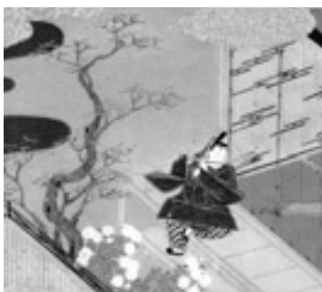
源氏物語ミュージアム所蔵 伝土佐光則筆「源氏絵鑑帖」より

「雨夜の品定め」の翌朝、光源氏は宮中から妻の葵の上(あおいのうえ)の住む左大臣邸に行きますが、方違(かたがた)えとして紀伊守(きののかみ)の邸に泊ることになりました。方違とは、曆によって悪い方角があり、その方角とは別の方角の家に入ったん泊まってしまうから出かけるという風習です。