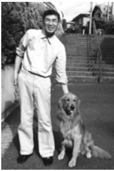
愛情と責任を持って飼いましょう