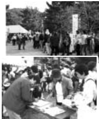
昨年のスタンプラリー(塔の島)

スタンプ帳の配布：配布中＝観光センター、市商工観光課、観光案内所(宇治橋西詰・近鉄大久保駅構内) 市内公共施設。10月上旬配布予定＝京都周辺の京阪・JR・近鉄の各主要駅(開催当日は京阪宇治駅、JR宇治駅、観光センター、各観光案内所で配布します)