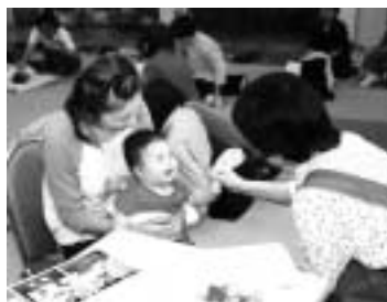
乳幼児健康診査の様子

十か月児健診は医師会に委託をして、市内の二十の医療機関、二十七人の小児科医師の協力を得て行う個別健診です。受診月の前月に送付する受診票を持って直接指定医療機関で受診してください。この時期は、乳児期から幼児期への移行期にあたり、病気や異常の発見のほか、運動面や