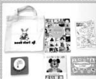
3か月児健診でお渡しするセット

食の準備の時期になりますので、栄養士が離乳食についての話をします。今年度から保育士もスタッフに入り、赤ちゃんの遊び方などの相談に応じています。初めての健診でも、不安な点について、