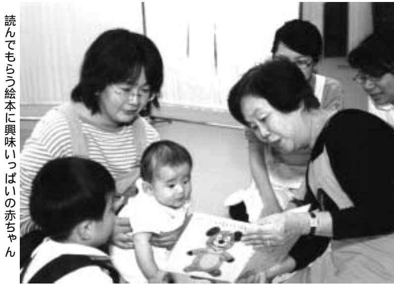
読んでもらう絵本に興味いっぱいの子ちゃん

今までの健診内容に加え、尿検査、視力検査も行います。大きくなったからこそ確認できる内容がたくさんあり、心身の成長を総合的に診ることが出来ます。精密検査が必要な場合には指定の医療機関で市が費用を負担する精密検査を受けていただきます。