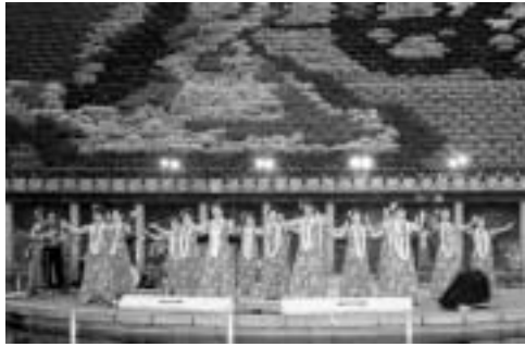
たそがれサマーコンサート(昨年)

8月2日(金)・3日(土)・4日(日) 午後9時半まで開園 (入園は午後9時まで)