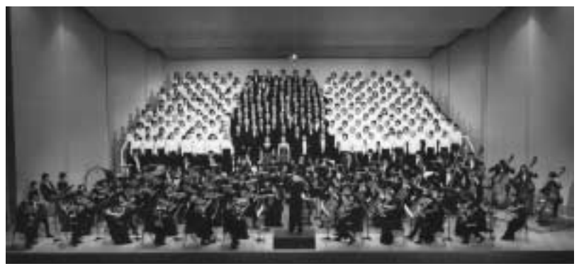
宇治市制施行50周年記念 第7回宇治市第九コンサート