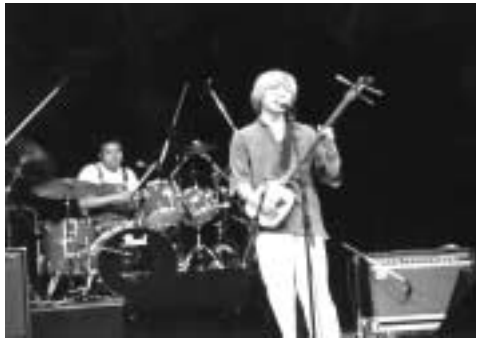
ライブジャック5th(昨年)

公募したボランティアの若者が枠にとらわれず創りあげるライブイベント「ライブジャック」。今年も昨年に引き続き、六月と八月