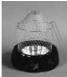
火取香をたくための道具