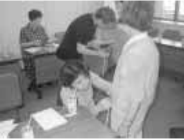
公募で選ばれたモデルの皆さんを6月に採寸

「高齢者と健康」をテーマにさまざまなイベントを行います。若い世代が作った服を高齢者が着るファッションショーなど世代間の交流も図ります。