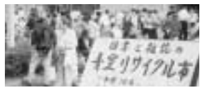
にぎわったりサイクル市

十月七日(日)に文化センターの職員駐車場を利用して青空リサイクル市が開催されました。ここでは、不要になった本や保存期間の過ぎた雑誌を無料で提供。これは資源の有効活用を図るため二年前から年に一度行っているものです。今年も約五百人の市民の皆さんが訪れ、にぎわいました。なお、児童書の一部は小・中学校の図書館で活用されています。