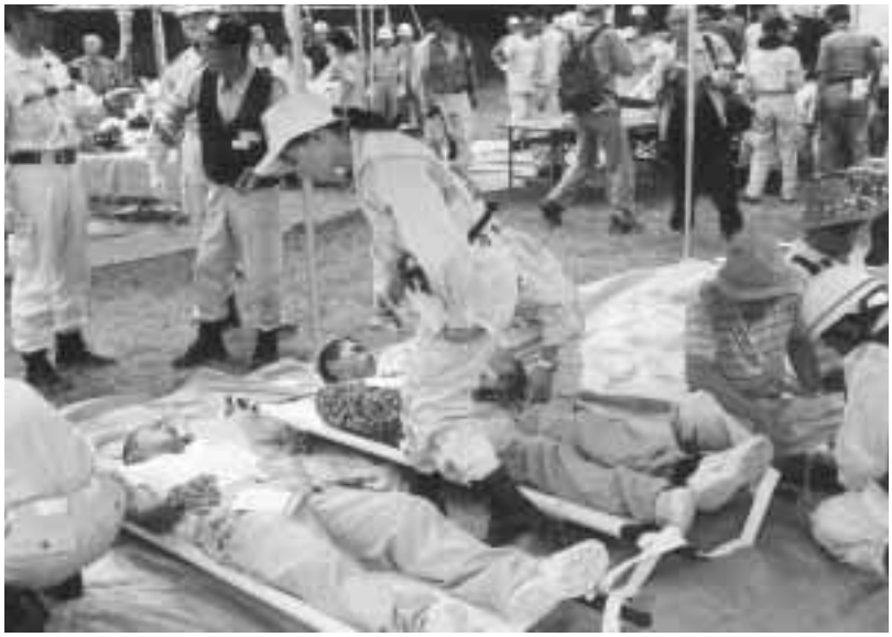
昨年度の防災訓練の様子

訓練は、九月八日(土)、午前九時半から十一時半まで、大開小学校グラウンドを会場として実施します(大雨等の警報発令の場合は中止します)。 大地震が起これば、防災関係機関は全力を挙げて災害の対策活動に従事します