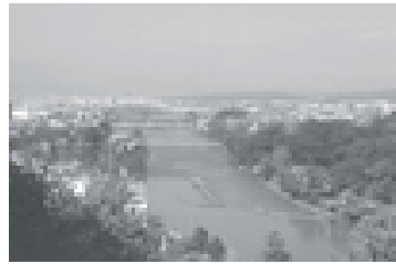
宇治川塔の島付近