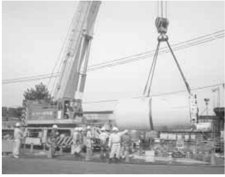
下水道本管シールド工事

ある東宇治浄化センターで汚水処理する区域で、昭和六十一年から下水道の使用を開始。六地藏・木幡地域の大部分と五ヶ庄・菟道・羽戸山一丁目の一部で下水道が普及しています。洛南処理区は八幡市にある京都府洛南浄化センターで汚水を処理する区域で、平成元年から下水道の使用を開始。横島町・小倉町・伊勢田町・開町・広野町・大久