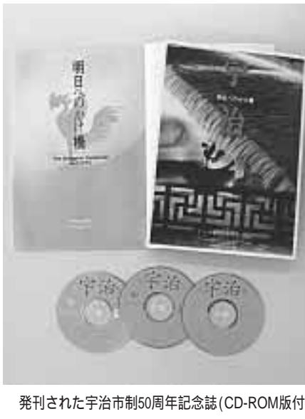
発刊された宇治市制50周年記念誌(CD-ROM版付)

市制施行五十周年記念事業の一環として「宇治市制五十周年記念誌」明日へのかけ橋」を発刊しました。宇治の四季の風景や豊かな歴史遺産、伝統文化の紹介をはじめ、五十歩の歩みをつなぐ美しい写真をまじえて振り返ります。また特別企画として瀬戸内寂庵氏と久保田勇宇治市長との対談「夢のかけ橋トーク」と題して源氏物語の魅力や宇治のこれからのまちづくりを語っていただきました。またこの記念誌には「CD-ROM版宇治市制五十周年記念誌」を添付していただきます。県まつりなどの伝統的な行事や、宇治大田楽、茶まつりなどが動画でご覧いただけます。さらに桜のころの宇治川、琴坂の紅葉平等院、源氏物語ミュージアムなど宇治の見どころをスライドショーで紹介します。そのほかにも、「宇治五十年のあしあと」や「茶どころ宇治」を映像やナレーションとともにご覧いただけます。この記念誌は市役所計画推進室(六階)で一冊千円で頒布しています。なお「宇治市制四十年誌」につきましても一冊千円で頒布しています。