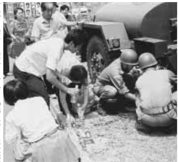
給水車による給水の状況