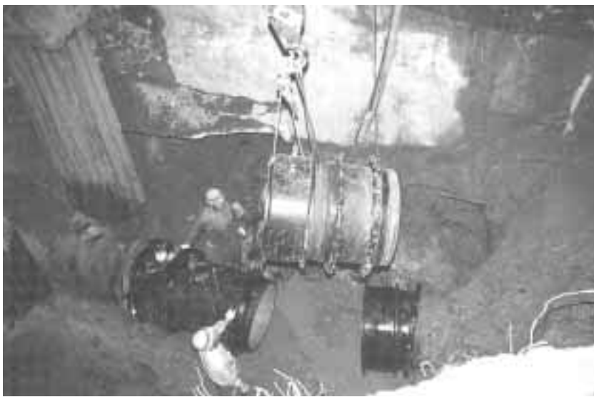
導水管の復旧工事 (7月27日午後9時)

この破損により道路に大量の水と土砂が流出し、付近の民家二戸が浸水しました。流出した水は約五〇〇トン、土砂は二トン車十台分以上となりました。断水発生から各家庭への給水が全域で復旧するまで三日間かかり、その間広い地域で断水状態が続きました。主に西宇治地域の三万五千世帯、九万二千人に影響がでました。府営宇治浄水場から送水している区域は、横島町・