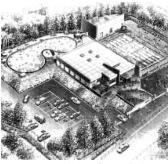
リニューアルされる黄檗公園プール(完成予想図)