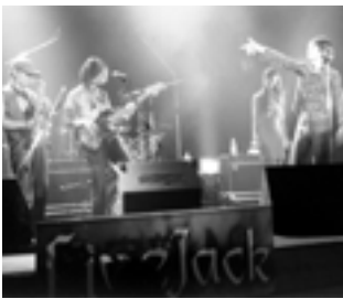
昨年のライブジャック4th

公募したボランティアの若者が卒にとらわれず作り上げるライブイベント「ライブジャック5th」(八月十二日(日)実施)への出演バンド公開予選会を六月三十日(土)、午後二時~八時半に文化センター小ホールで