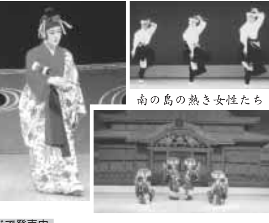
南の島の熱き女性たち