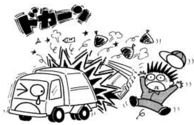
<収集車の火災事故が多発しています。>

スプレー缶等は “特に注意” 四月からスプレー缶・カセットボンベ缶類は別々の袋に分け、もえないごみの日に出すことになりました。しかし、四月早々から「中身が入ったままのスプレー缶類を出されていること」が原因とされる収集車両の火災事故が多発しています。最近ではフロンガスに替わり、