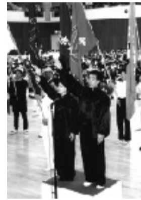
昨年の総合開会式

宇治市制施行五十周年記念第三十五回市民総合体育大会が五月十三日(日)から開催。二十五競技に市民の皆さんが技と力を競います。この大会は市民のスポーツ振興と余暇の有効活用、健康づくりを目的に開催するものです。競技日程は左のとおり。あなたも出場してみませんか。