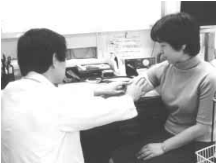
▲基本健康診査は無料。市内の協力医療機関(2面に掲載)で受診を

生活習慣病の予防 わが国の三大疾病であるがん・脳卒中・心臓病は四十歳前後から急激に死亡率が高くなり、しかも全死因のなかでも上位を占め、四十歳から六十歳ぐらいの働き盛りに多い疾患と考えられています。これらの疾病の発症が、生活習慣と深く関係していることが明らかになってきました。