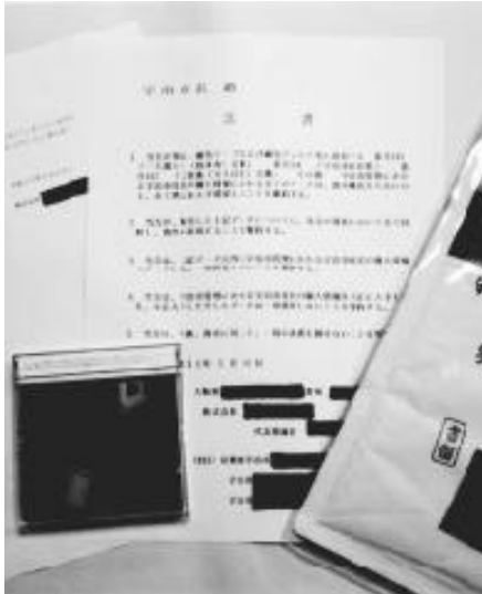
届いたMOと手紙、取り付けた念書