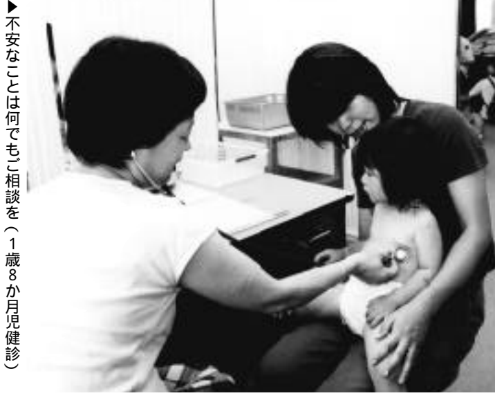
▶不安なことは何でもご相談を(一歳八か月児健診)

一歳八か月健診の時点では虫歯の罹患率は三％から四％ですが、三歳児健診の時点になると、その十倍の四〇％前後に増加しています。幼児期の虫歯をいかに防くかが課題となっています。また、柔らかい食品が増え、かむことが少なくなり、歯のかみ合わせの異常が増加しています。