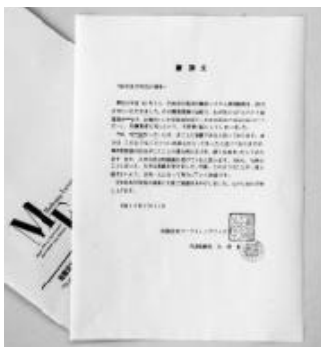
提出された謝罪文

七月十二日にマーケティングファクトリー社から上記内容の謝罪文(写真)が提出されました。なお、刑事告発は不起訴となつているため、関係者は、紙面の本文の全部と謝罪文の一部をアルファベットで表記しています。ご了承くださいようお願いいたします。