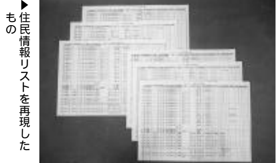
住民情報リストを再現したもの

データの一刻も早い回収と消去が先決と考え、電話や訪問により接触を試みるうちに、大阪府内のリストコンサルタント会社から名簿全件が記録されたMO(光磁気ディスク)と謝罪の手紙が市に書留郵便で届きました(写真左上)。市は直ちにこの会社に職員を派遣し、会社のパソコンに保存されていた宇治市に関する全データを消去するとともに、販売されていた三件の宇治市関係名簿もすべて回収しました。