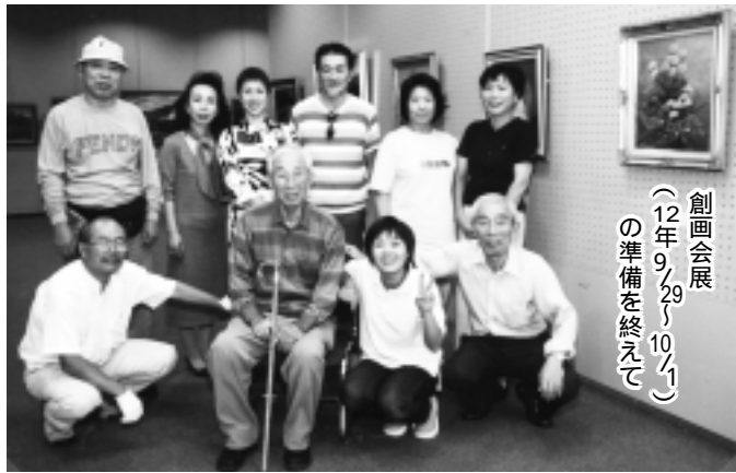
創画会展(12年9/29~10/1)の準備を終えて