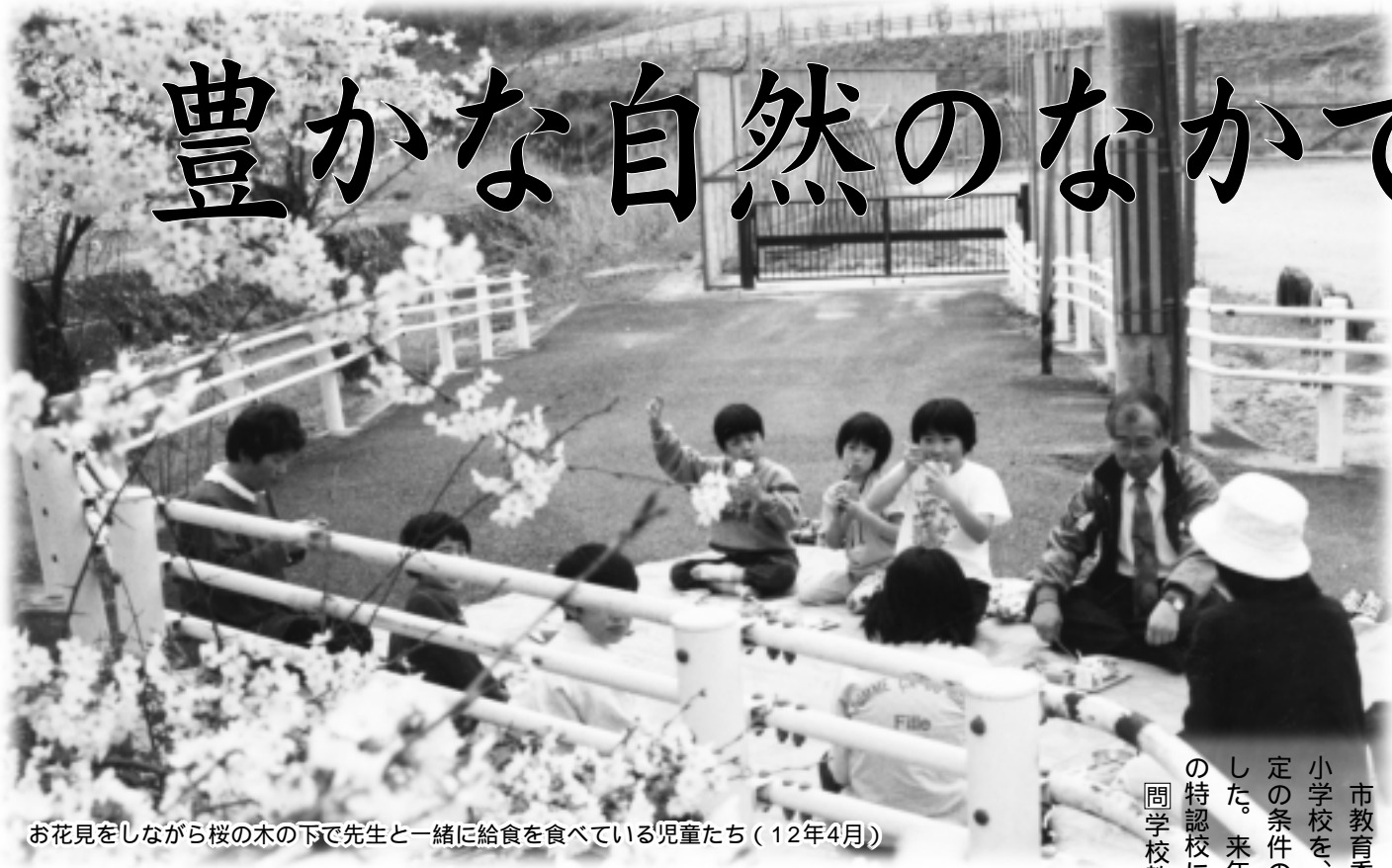
お花見をしながら桜の木の下で先生と一緒に給食を食べている児童たち(12年4月)