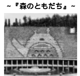
植物公園写真コンテスト 作品展も開催中 10月22日(日)まで