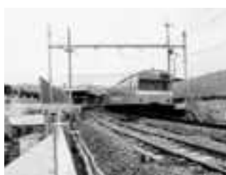
建設中のJR小倉新駅(12年12月)