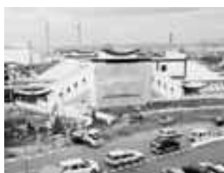
整備中の宇治駅前広場(12年12月)

ます。その他普通電車も増発され、今まで以上に便利になります。なお、市の事業として、宇治駅並びにJR小倉駅において、それぞれ南北を結ぶ自由通路、駅前広場、