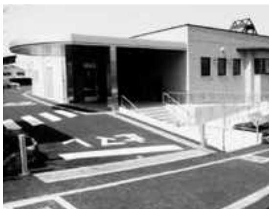
住みよいまちづくりに生かされるあなたの税金 (昨年4月に開所した広野地域福祉センター)

発行 宇治市 編集 広報課 〒611-8501 宇治市宇治琵琶33 ☎ 22-3141(代表) FAX 20-8779 ホームページ http://www.city.uji.kyoto.jp/