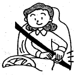
宇治市交通安全対策協議会

シートベルト・チャイルドシート の着用の徹底と子供や高齢者を見かけたらスピードを落として、より安全な運転をしましょう。 無謀運転と暴走行為はやめて、交通事故防止に努めましょう。