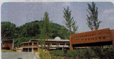
▶ 6月4日にオープンした総合野外活動センター「アクトパル宇治」(右)管理棟・1Fエントランス