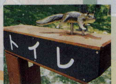
トイレスの案内板

● 宿泊室 … 洋室(写真・上)・和室(同・下)があり、洋室は車いすで利用できます。管理棟宿泊室にはトイレ・洗面所付き。また、管理棟2階には大浴室が2つあります。このほか宿泊棟「星の館」には介護浴室を設けています。