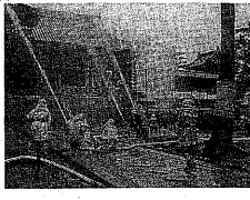
▲昨年の社寺消防訓練(黄葉山萬福寺で)

1月26日は文化財防火デーです。市内には宇治上神社や平等院を始め多くの文化財があります。消防本部では「火災から守ろう みんなの文化財」をスローガンに1月23日(金)から29日(木)まで文化財特別調査や社寺消防訓練など防火運動を実施します。市民の皆さんも火の取り扱いに十分注意して、貴重な文化財を火災から守りましょう。