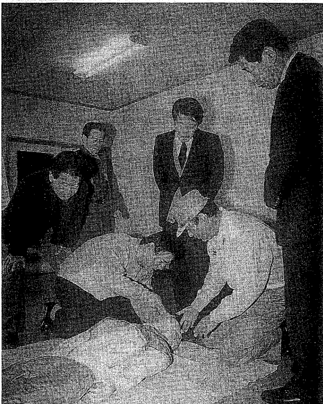
▲ダミー人形を使った心肺蘇生法の指導

急な病気やけがで生命の危機にある人を救うのに役立つ救急車。市では、市内五つの消防(分)署に救急車を配置し市民の通報に即応し出動できる態勢を整えています。 平成八年の統計を見ると救急出動は四千五百五十五件、搬送した人は四千四百十三人でした。前年と比較するとそれぞれ百四十一件