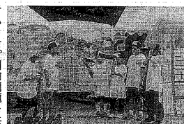
▲かわらっ子劇団による劇

第二十二回河原解放文化祭が、十月十一日(土)に木幡河原隣保館で開催されます。町内各団体の出し物を中心に多彩な内容になっ