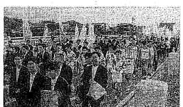
▲京都総体300日前記念事業で新宇治橋をパレードする高校生たち