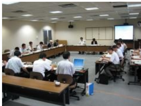
歴史的風致維持向上計画検討委員会