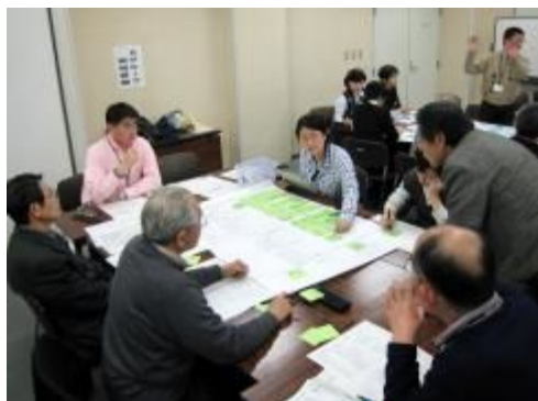
歴史まちづくりワークショップ

なお、国の認定を受けたのちは、計画に基づき事業を実施する。計画を進めるうえでは、市民の声を取り入れるとともに、関係課で組織する「歴史まちづくり推進調整会議」で調整し、「歴史的風致維持向上協議会」の意見を伺い、事業の進捗管理や変更・追加を行うこととする。