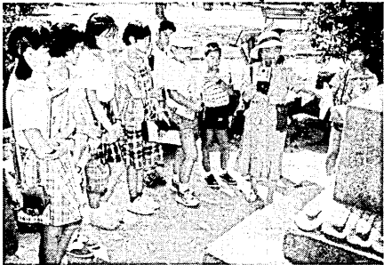
平和記念公園。語り部と呼ばれる人たちが、原爆の恐ろしさを後世に伝えようと、被爆体験を語り続けている

その日、一瞬にして多くの命が消えた。そして、生き残った人も、体や心に消えることのない苦しみを背負った。宇治市平和都市推進協議会が募集した小学六年生と中学一年生、三十九人の広島訪問団