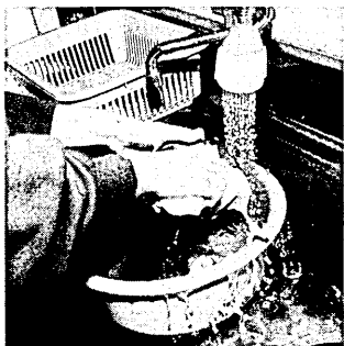
知らず知らずのうちに川を汚していますか

環境問題について 高まる知識・進む実践 まず、どんな環境問題に関心をお持ちかお聞きしました。 (一) 地球規模の環境問題のうち、次の問題に関心をお持ちですか (ア) オゾン層の破壊 125人(75.8%) (イ) 地球の温暖化 122人(73.9%) (ウ) 熱帯林の減少 101人(61.2%) (エ) 酸性雨 124人(75.2%) (オ) 地球の砂漠化 70人(42.4%) (二) 環境問題について、次の項目で、半数以上の方が関心があるか、あるいは、関心があります。また、フロロクロロカーボンが地球のオゾン層破壊の原因となっていることをご存知ですか。 (ア) 海洋、河川、湖沼などの汚染 155人(93.9%) (イ) 野生生物種の減少 94人(57.0%) (ウ) その他 24人(14.5%) (エ) 複回答あり 94人(57.0%) (三) 環境問題に対する関心や知識を持つていることが、かかえ手、また、使った古紙の食用油や古紙の処分方法の質問では、そのままだという人が少なく、ほとんどの人が適正に処分しています。 (四) 使い古しの食用油は、どのように処分されていますか (ア) 紙などに吸わせて固めた後に、ゴミとして出して 16人(70.3%) (イ) 廃油回収に出している 1人(4.8%) (ウ) その他 9人(46.0%) (エ) 複回答あり 18人(13.0%) (五) 環境問題について、多くの人が、なにか意識して、なにかの行動をとっていることがわかりました。 (六) 使い古しの食用油は、どのように処分されていますか (ア) 紙などに吸わせて固めた後に、ゴミとして出して 16人(70.3%) (イ) 廃油回収に出している 1人(4.8%) (ウ) その他 9人(46.0%) (エ) 複回答あり 18人(13.0%)