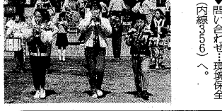
前9時止。この森(宇野町八軒屋、太陽が丘)で、子供たちも熱演を披露します(3月21日のリハーサルで、練習済み)。