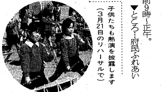
この模擬植樹祭は、本 番と同じタイムスケジュール で、花壇や芝生、華やか な装束の演奏やステージ も、ぜひ参加してください。 ▼つき4月28日(日)午後

五月二十日(日)行われ る「模擬植樹祭」(第 四十二回)全国植樹祭の総 合リハールとして、模擬 植樹祭が開かれます。雨天 中止。