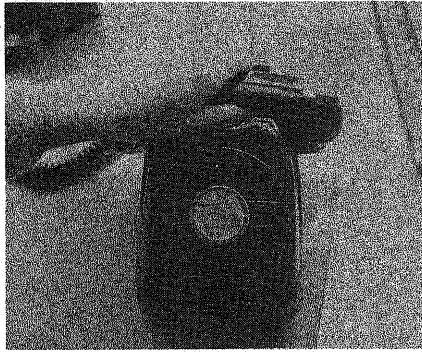
▲電話の向うには、種に考えをくわえが待っています

市では、昭和五十七年に「宇治「ママ」の電話」を設置し、それ以来、悩みを抱える青少年や親からの、電話相談に応じています。電話を通じて、温かい会話を交わすことができれば、悩む心にも、きつと希望の光が見えることでしょう。今回は、相談員として活動しておられる皆さんに、この「宇治「ママ」の電話」での相談活動の内容や、青少年問題でのアドバイスを行いました(相談員氏名は公表していません。文中の話は複数の人から伺いました)。