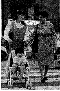
女性が、いつまでもイキイキと明るく過ごせる社会を