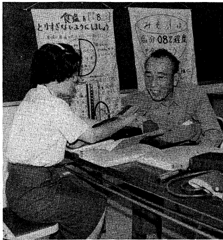
▲成人病予防に役立っていたら、「血圧健康相談」を行っています。相談の日程・場所などは「市民センター」と手引きをご覧ください(6月29日、小倉公民館で)

近年、我が国では「人生80年」と言われるようになりました。市民の皆さんがより健康な生活を送れるよう、市では、基本健康診査・各種がん検診や血圧健康相談など様々な事業を行っています。今回は、特に健康づくりのための食生活について考えてみました。