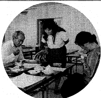
▲減塩食試食も同時に行っています

IV 脂肪は量と質を考えて 近ごろ、脂肪を取るがだんだん増えています。脂肪は取り過ぎると、動脈硬化の原因となり、動脈硬化の原因は、動物性の脂肪(飽和脂肪酸)です。 よび、植物性のものを多く取るようにしてください。 (宇治市健康福祉課)