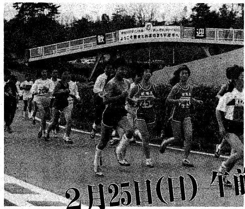
▶ゴールを目指し力走(昨年の宇治川マラソン)

第7回宇治川マラソン大会は、2月25日(日)、午前10時に太陽が丘をスタート。今大会には、中学生から85歳まで、昨年を上回る2,094人が参加。遠くは埼玉、神奈川などからも集まったランナーが、5キロ、10キロ、20キロの3部に分かれて、それぞれゴールを目指します。市民の皆さんも、ぜひ温かいご声援をお送りください。なお、当日は交通規制が行われます。ご協力ください。