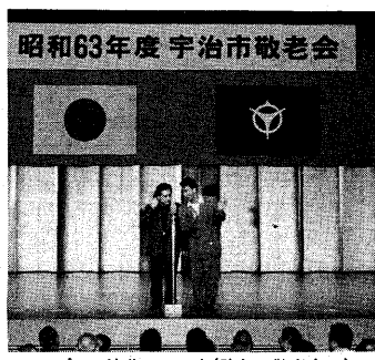
▲プロの演芸ショーも（昨年の敬老会で）

長寿社会に貢献されてきた高齢者の皆さんの労苦をねぎらい、敬老の日を築き上げていこうと、敬老会を開きます。 敬老会は、九月十五日（午前）の部（午後）の部と午後（午後）の部（四時半）の部（文化センター）で開催。参加を申し込み、お申し込みは、既に案内はがきをお送りしています。 当日は、米壽茶会贈呈などの式典の後、演芸の部では、チャペリ娘、小川あぶる、たまの囃子、真山郎船曲の芸能ショーを楽しんでいただきます。 また、参加者賞に記念品を用意しています。