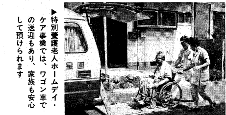
▶特別養護老人ホームデイ・ケア事業では、ワゴン車でのご送迎もあり、家族も安心して預けられます