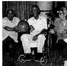
機能回復訓練は、やる気と根気が必要です