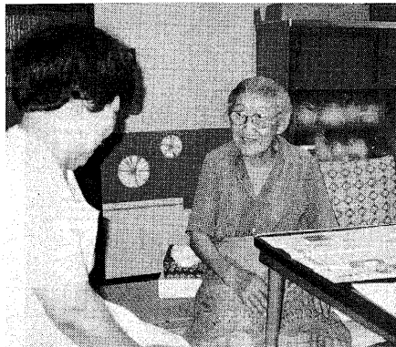
▲ホームヘルパー（家庭奉仕員）さんとの話らいも楽しい

り老人に います。 尿器、 当部分に 長交付1 利用回 別に自宅 車、高齢 りして、 車に對す と設置。 と認め 回復を図 り理由に ことがで るに常時 ホーム 技術の向 導・向上 かに必要 について 内・精神