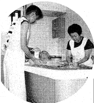
▲入浴サービスで、お風呂に入れて良かったね。気持ちいい！