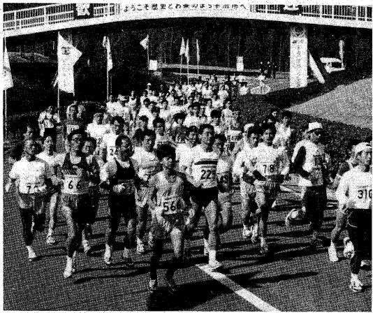
▲ゴールを目指して力走 (第5回宇治川マラソン大会で)

第6回宇治川マラソン大会は、2月26日(日)、午前10時に太陽が丘をスタート。競技は5キロ、10キロ、20キロの3部に分かれて行われます。今大会では、遠くは新潟からも参加者があるなど、前回は112人上回る2,078人が健脚を競います。市民の皆さんも、温かいご声援をお送りください。なお、大会当日は交通規制が行われます。ご協力ください。