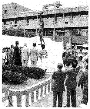
▶「平和の像」の除幕式

この像は、赤みが右の台座の上、平和のシンボル・ハト女性がデザインされたブロンズ像で、高さ三・一四メートル。大空・平和に向かひ、まさに飛立とうとするハトを高く掲げ理想の彼方をうつめています。八月十五日の終戦の日、市平和都市推進協議会の主催