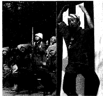
▲町かどの芸能

桜の花のほかに合わせて、第十二回宇治川さくらまつりが府立宇治公園の島一帯で開催されます。今年は、野尻町・宇治川春の市・炭山町まつりの外、町かどの芸能(おさだ塾)なく盛りだくさん・充実した内容となっております。 ▼宇治川春の市：夜交は・榎木市・地場産物売・銘酒コーナー・竹細工 ▼町かどの芸能：6日は午後1時30分、10日は午前11時、午後1時、3時 ▼日誌：宇治川さくらまつり、10日(日)午前10時、午後4時、府立宇治公園で観光センターにて開催。