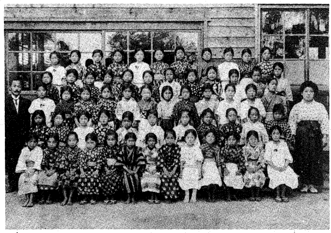
▲菟道尋常高等小学校の学級記念写真(大正9年7月撮影)

発行 京都府宇治市 編集 広報課 〒611 京都府宇治市 宇治琵琶33番地 電話 (0774)22-3141 毎月1日・11日・21日発行