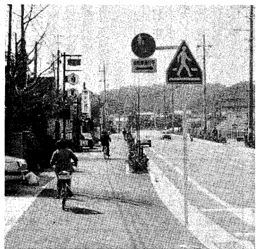
効果的な交通制により歩行者が安心して歩ける道路を確保する。