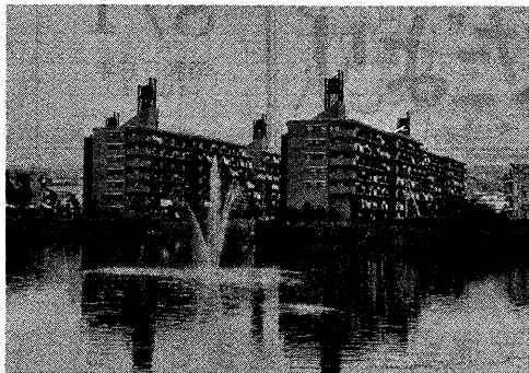
木幡池に 涼呼ぶ噴水