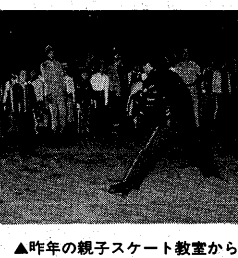
▲昨年の親子スケート教室から